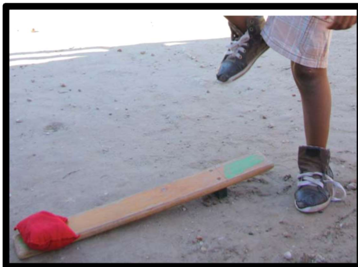
Stampen en vangen!

Wil je zelf ook één of meerdere stampertjes bestellen, mail dan naar info@zanethemba.nl en vraag om meer informatie.