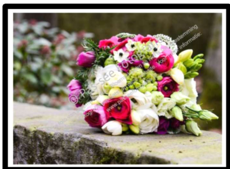
Bruidswerk gemaakt door Nel

Nel Hoevers verzorgt al een aantal jaren bloemschikworkshops waarvan alle opbrengst naar onze stichting gaat. Naast de geplande workshops, is maatwerk én bruidswerk ook mogelijk.