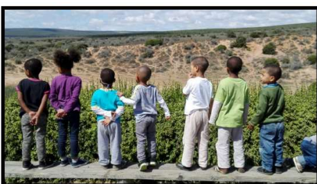
Verwondering bij het zien van de olifanten

De oudere kinderen van de Haven zijn naar een wildpark geweest. Voor het eerst van hun leven zagen ze olifanten. Een onvergetelijke ervaring. De kinderen hadden een geweldige tijd!